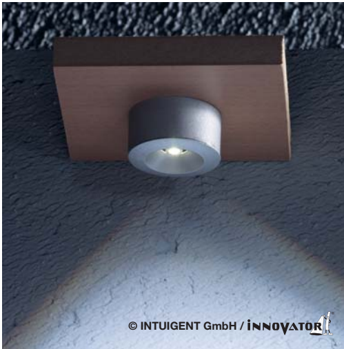
NEGI Variante: Aufbau